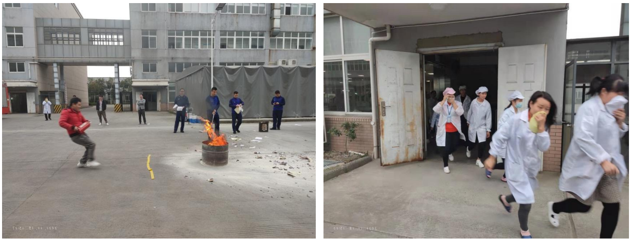
图 6.3-01 消防应急演练现场

公司每年举行消防演练和各种灾害应急演练。公司制订了《配电房火灾、爆炸应急预案》等应急预案、《触电事件应急预案》、《重大设备故障应急预案》等应急处置方案等，对火灾、机械、触电等均有相应的应急措施，并成立了应急指挥中心和应急救援专业组。