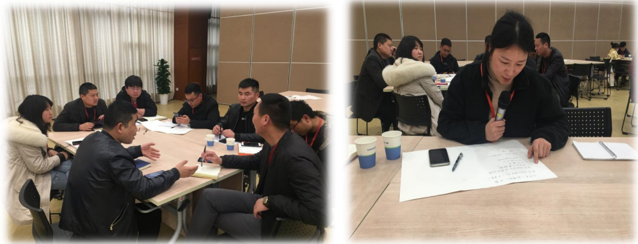
图 3.2-1 各类培训活动

公司每年针对实际和市场形势，识别各部门的培训需求，制定员工培训规划和年度计划，开展职工教育培训，包括质量意识、质量知识、管理制度、专业知识等培训内容。公司每年制定并下发了《年度培训计划》等，对质量诚信教育进行了安排布置。