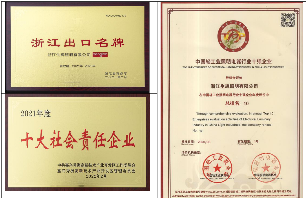
图 3.3-1 社会认可的证书（示例）